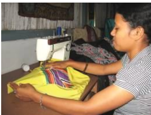
naaimachine in het kindertehuis Ceria ,West-Timor