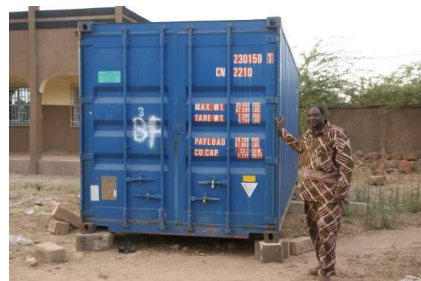
.... en in Burkina Faso