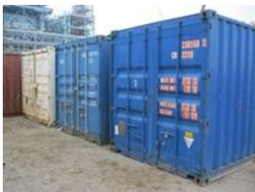
de NEM containers in de Eemshaven

In het jaarverslag van 2012 schreven we over de bijzondere gift van drie zeecontainers die we van de NEM (= Nederlandse Electrolasch Maatschappij) kregen. Een bedrijf uit Gouda heeft de containers opgehaald: één container is in gebruik genomen als opslagcontainer en staat bij in Gouda bij 'de Baanderij', de verlader van GG. De andere twee containers zijn voor de verscheping van gereedschap gebruikt. In de GG-nieuwsbrief van februari 2013 herkenden we één van de drie geschonken containers die was terechtgekomen in ..... Burkina Faso!