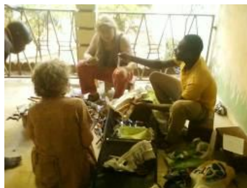
koffer met gereedschap wordt uitgepakt in Mali.